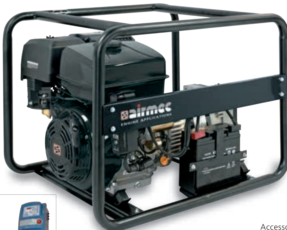
Accessorio - Accessory

LS 5000-E AVR ATS Avviamento automatico in caso di black out